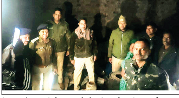
देवास। अवैध शराब के खिलाफ कार्रवाई करते हुए पुलिस और आबकारी अमला।

अवैध शराब के विक्रय, संग्रहण व परिवहन करने वालों पर हुई कार्रवाई