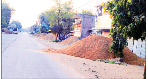
हरिभूमि न्यूज आष्टा

जावर नगर में स्थित सोसायटी भवन के आस पास वाली जगह पर बालु रेत की बालु व्यापारियों ने अब तो हद ही पार कर दी है। रेत व्यापारियों ने रोड़ किनारे ही लगाने लगे रेत का ढेर। आप दिन होने लगे एक्सिडेंट और दो पहिया वाहन फिसलने लगे प्रशासन का नहीं कोई डर। जावर नगर में बालु रेत बेचने वालों की चल रही मनमानी और यह तक आ गए हैं की रेत बेचने वाले को बिल्कुल भी नहीं डर है। इस कारण आप दिन दो पहिया वाहनों के एक्सीडेंट हो रहे है। गाड़ीयां बालु रेत पर रिसप भी मार रही है। लेकिन अधिकारियों का इस ओर कोई ध्यान नहीं है। रेत माफिया पुरी तरह से कर रहे धन्दे रोजाना दो पहिया वाहन चालक गिर कर गम्भीर हो रहे हैं। लेकिन प्रशासन का कोई भी अधिकारी इस ओर ध्यान नहीं दे रहा है।