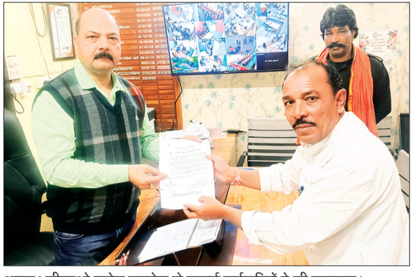
आष्टा। सीएमओ राजेश सक्सेना से सफाई कर्मचारियों ने की मुलाकात।